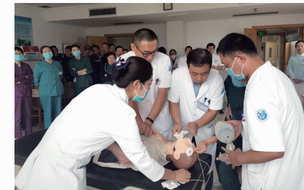
10月9日，在门诊举办第三次医护联合抢救培训及演练。