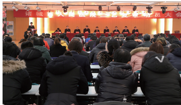
1月4日下午，我院召开三级乙等医院复审动员大会，全面启动迎接三乙复审工作。

医院等级是医院功能、任务、规模和管理水平、质量水平、技术水平的综合标志，是医院综合竞争力的体现。我院在三级医院迎审过程中，紧紧围绕“质量、安全、服务、管理、绩效”主题，有计划、有针对性地开展迎审工作，态度认真、认识到位、积极互动，全院上下展现出了良好的精神风貌和积极的工作氛围，通过聚焦问题和困难，抓实持续整改，把握医疗质量“着力点”，坚决打赢三乙复审这场攻坚战。