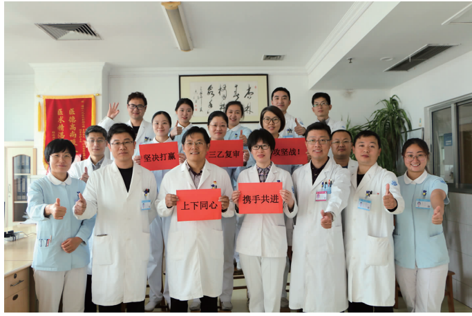
一位职工的荣誉, 这种荣誉感让我们充满斗志。上班时每个护理人员都充分利用自己的长处补足了别人的短处, 你护患沟通能力强, 我病情掌握能力强, 她专科知识能力强, 相互之间会不吝指教。加班时间, 我们“惜时如命”的利用每一分每一秒, 自发分成几个小组, 背诵“三乙评审应知应会”“医院核心制度”, 演练“工作流程”“应急预案”。

术感染率及非计划二次手术率, 严格遵循抗菌药物应用指征等, 持续改进医院感染管理控制质量, 保障医疗安全, 使科室的工作效率及工作质量进一步提高。 古人云“千人同心, 则得千人之力, 万人异心, 则无一人之用”, 为了以最好的面貌迎接复审, 科室中人人热情饱满, 各司其职, 作为手术较多的科室, 平时的工作繁琐、忙碌, 但全科人员齐心协力, 变压力为动力, 为科室的管理、改进出谋划策, 在未来的工作中, 我们会一如既往的坚持端正的工作态度, 遵循各项医疗规章制度, 坚持“评审促进发展, 评审与建设并举”的原则, 做好本职工作, 提高医疗质量, 提高自己的业务水平与服务能力, 为复审工作的成功贡献自己的力量。(肝胆外科主治医师 李洪森)