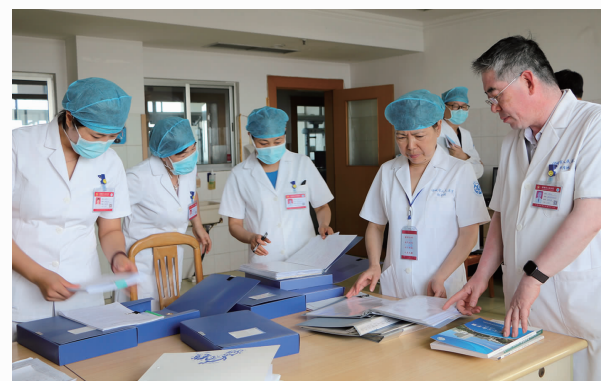
6月25日，我院党委领导班子协助内审组分别到ICU、急诊科、高压氧室等困难科室进行现场督导。