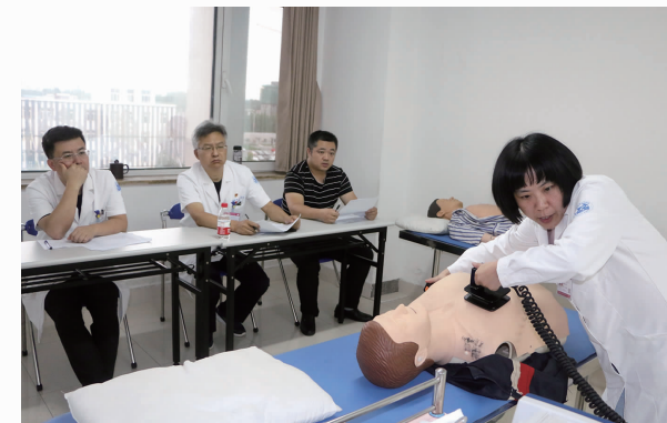
7月12日-8月26日，对全院所有人员分批次进行应知应会知识、心肺复苏术、六部洗手法、灭火器使用的培训、考核与比武。