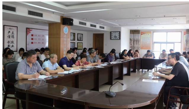
3月30日，召开第一次院级督导组检查反馈会议，14个督导组分别汇报督查中存在的问题，并提出整改意见。